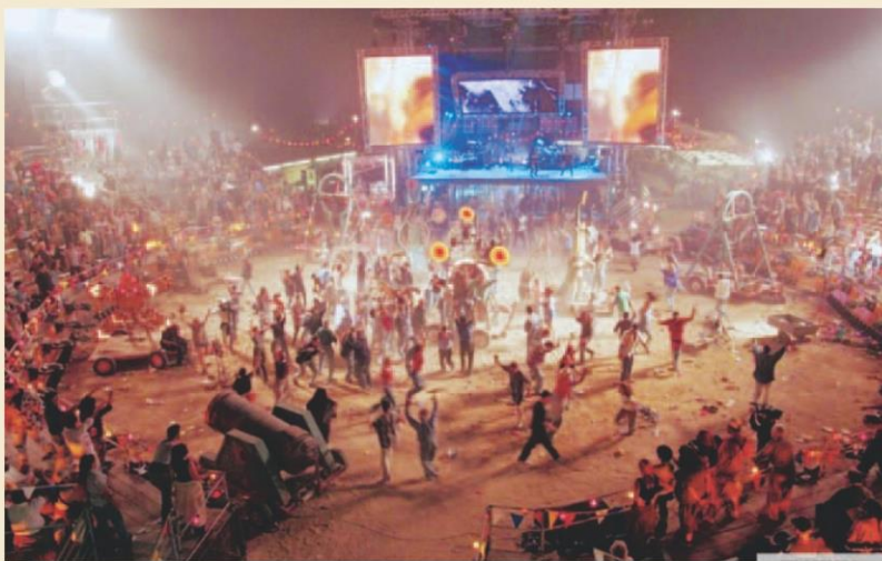
Шоу «Ярмарка плоти», где устаревших роботов уничтожают перед ликующей толпой (к/ф «Искусственный разум»)

Как ни странно, исследователи утверждают, что у роботов будет возможность обманывать людей. Объясняется это тем, что такое поведение встречается у животных и означает наличие истинного социального интеллекта, который позволяет ужиться в обществе. Таким образом, понимая такую возможность, мы всячески интегрируем роботов в человеческое общество.