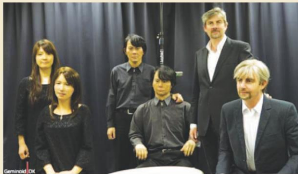
В марте 2011 г. гоминиды и их создатели встретились в Киото (Япония)

Число роботов в мире исчисляется миллионами. На данный момент их общее количество неизвестно, но в 2008 г. согласно обзору Международной Федерации Робототехники. (International Federation of Robotics) в мире существовало более 6,5 млн. роботов. Они образуют и занимают отдельную нишу: технологическую, бытовую и социальную. Тот же Азимов в 1986 г. на фоне всплеска робототехники в романе «Роботы и Империя» дополнил свои законы и предложил Нулевой Закон: «Робот не может причинить вреда человеку, если только он не докажет, что в конечном счете это будет полезно для всего человечества». В совокупности с третьим законом возникает возможность самозащиты робота от посягательства человека, причиняющего вред роботу.