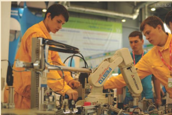
Люди и промышленные роботы на выставке «Иннопром-2012»

ка» выяснены не до конца и также требуют более глубокого изучения, особенно при возможности перехода человеческого сознания в киберпространство.