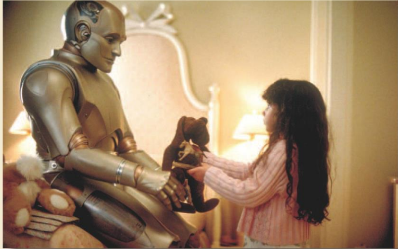
Робот Эндрю из к/ф «Двухсотлетний человек»

Интересна идея П.Мюллера, представителя Мюнхенского перестраховочного общества в РФ, Украине и Беларуси. Он видит роботов и ИИ как новый страховой продукт третьего тысячелетия высокой стоимости. С его слов, роботы стали массовым явлением во всех областях производства и общественной жизни и постепенно освобождаются от непосредственного управления человеком. Автономность роботов приведет к необходимости защищаться. Их будут похищать, разбирать на запчасти и т.д. Но дело тут в другом — чтобы предотвратить такие преступления, роботов необходимо персонализировать. Иными словами, будет введена всеобщая паспортизация. Только, в отличие от паспортов собак и кошек, это будут государственные реестры, как например базы владельцев автомобилей. Отметим интересный факт: владельцы робо-собак всерьез относятся к ним, как к живым. Понятно, что AIBO или